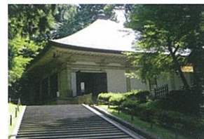
中尊寺金色堂は青森ヒバで建てられ900年経った今でもその木は健在

それはヒバに多く含まれる精油成分、天然ヒノキチオールのはたらきによるものです。ヒノキチオールはその名前から、ヒノキの木に多く含まれていると思われがちですが、実は青森ヒバに最も多く含まれています。