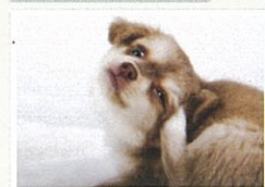
頭や耳を痒がったら要注意

動物も人も、刺されると激しいかゆみに襲われるノミ。湿疹や脱毛が現れるノミアレルギー性皮膚炎を発症することもあります。また、条虫の卵を宿したノミを犬や猫が食べてしまうことで、瓜実条虫（サナダムシ）に寄生され、下痢や嘔吐が起こる場合も。ノミは高温多湿を好みますが寒さにも耐えて繁殖を繰り返すので、一度ついたノミには継続的なケアが必要となります。